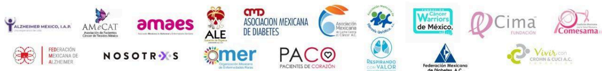
FUNDACIÓN ALZHEIMER LEÓN "Alguien con quien contar" A.C. INSTITUTO DE LA MEMORIA