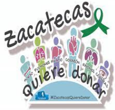
Zacatecas Quiere Donar