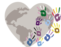
Coalición De La Diversidad Quintana Roo. (CODISCUN A.C)