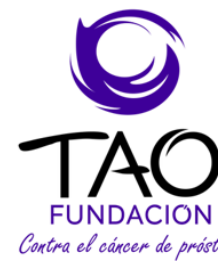
Fundación TAO "Contra el cáncer de próstata"