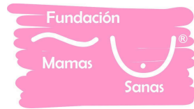
Fundación Mamas Sanas A.C.