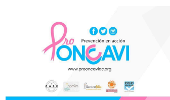
PRO ONCAVI A.C. (Pro Oncología y Calidad de Vida)