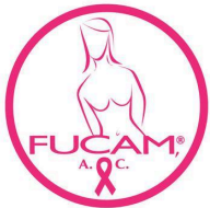
Fundación de Cáncer de Mama FUCAM, A.C.