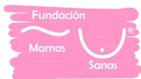
Fundación Mamas Sanas A.C.