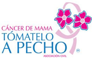
Tómatelo a Pecho, A.C.