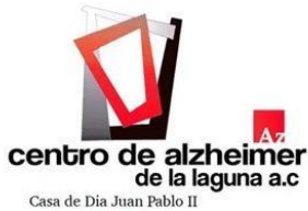
CENTRO DE ALZHEIMER DE LA LAGUNA A.C.