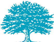
Fundación Mario Robles Ossio, A.C.