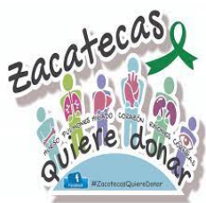
Zacatecas Quiere Donar