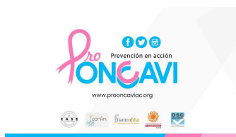
PRO ONCAVI A.C. (Pro Oncología y Calidad de Vida)