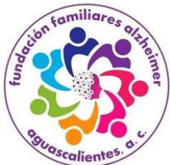
FUNDACIÓN FAMILIARES DE ALZHEIMER AGUASCALIENTES A.C.