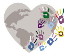
Coalición De La Diversidad Quintana Roo. (CODISCUN A.C)