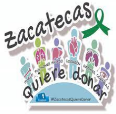
Zacatecas Quiere Donar