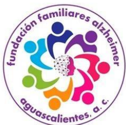
FUNDACIÓN FAMILIARES DE ALZHEIMER AGUASCALIENTES A.C.