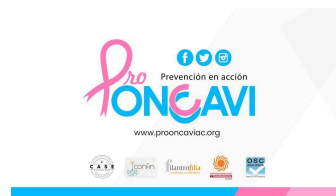
PRO ONCAVI A.C. (Pro Oncología y Calidad de Vida)