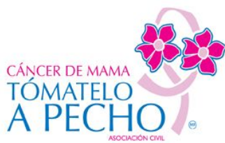
Tómatelo a Pecho, A.C.