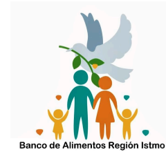
Banco de Alimentos Región Istmo A.C.