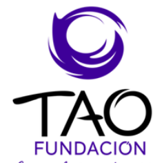
Fundación TAO "Contra el cáncer de próstata"