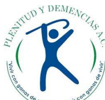
PLENITUD Y DEMENCIAS A.C. GUADALAJARA