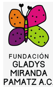
Asociación Gladys Miranda Pamatz A.C.