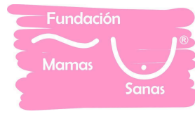
Fundación Mamas Sanas A.C.