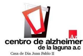
CENTRO DE ALZHEIMER DE LA LAGUNA A.C.