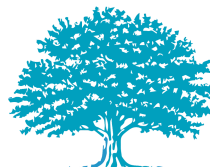
Fundación Mario Robles Ossio, A.C.