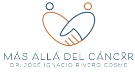
Fundación Dr. José Ignacio Rivero Cosme-Más Allá del Cáncer