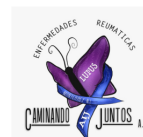
Caminando Juntos A.C