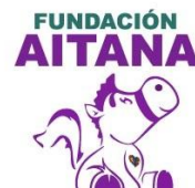
Unidos por Aitana A.C. (Quintana Roo)