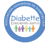
Asociación Sonorense de Diabetes I.A.P.