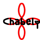
Fundación Chabely A.C.