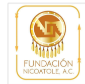
Fundación Nicoatole A.C. (Oaxaca)