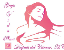
Fundación Vida Plena Después del Cáncer