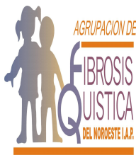
Agrupación de fibrosis quística del noroeste IAP