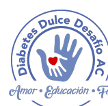
Diabetes Dulce Desafío A.C.