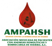
Asociación Mexicana de Pacientes con Anemias Hemolíticas y Sobrecarga de Hierro A.C