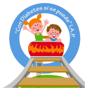
Con Diabetes si se puede I.A.P.