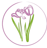
CECPAM CENTRO DE CUIDADOS PALIATIVOS DE MÉXICO