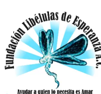
Fundación Libélulas de Esperanza A.C.