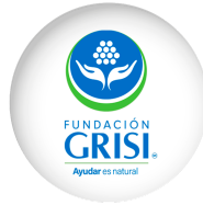
FUNDACIÓN GRISI A.C.