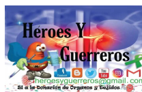
Héroes y guerreros pacientes de insuficiencia renal crónica y trasplante de riñón