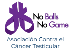
Asociación Contra el Cáncer Testicular