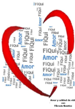
Amor y calidad de vida con Fibrosis Quística